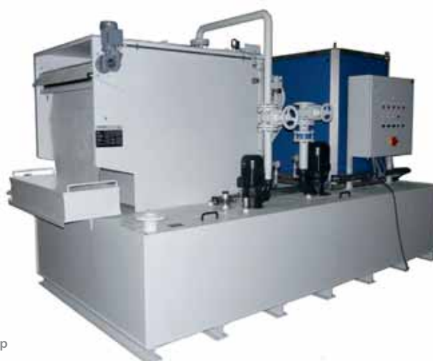
Наклонный ленточный фильтр