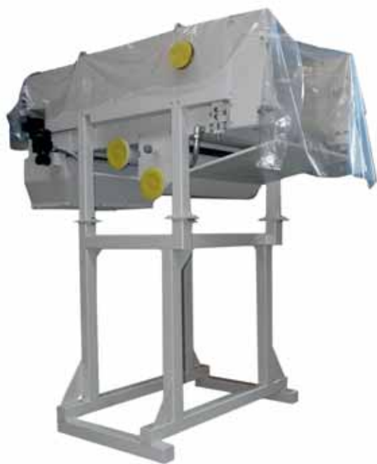
Откидной ленточный фильтр

Производительность зависит от размера фильтра и фильтрующего материала.