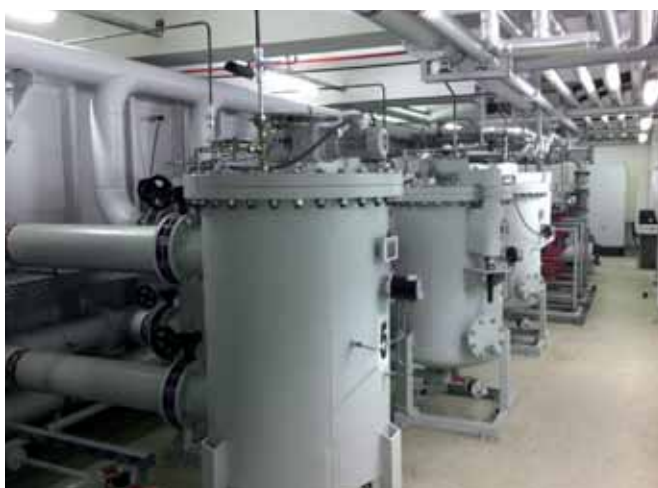
Фильтры с обратной промывкой Успешное использование в самых стесненных условиях одним из крупнейших автопроизводителей